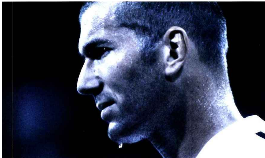
ZIDANE : UN PORTRAIT DU 20 e SIÈCLE, 2006

Image extraite du film. 35 mm, couleur, son, durée : 90 minutes.